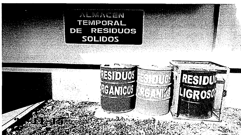
ALMACÉN TEMPORAL DE RESIDUOS SÓLIDOS