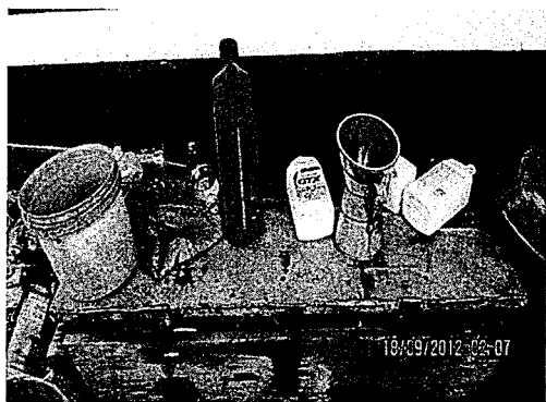
Foto N° 03: En el establecimiento de Percy Joel Palacios Gamarra, Los residuos NO se encuentran acondicionados de acuerdo a su naturaleza física, química y biológica.