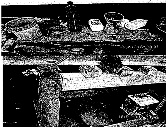
Foto N° 06: En el establecimiento de Percy Joel Palacios Gamarra, Realiza el almacenamiento de residuos sólidos a granel sin su correspondiente contenedor.