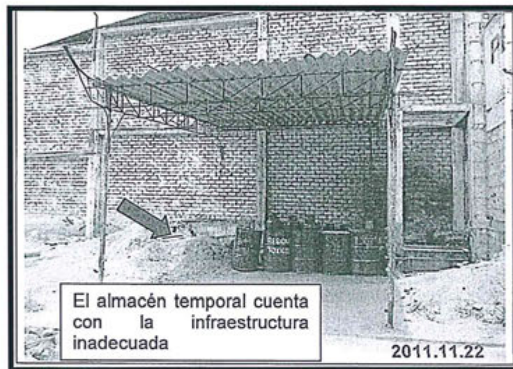
Fotografía N° 3