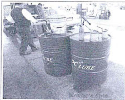
Fotografía 3. Recipientes (cilindros de metal) conteniendo aceite para vehículos para su expendio, se observa su manipulación.