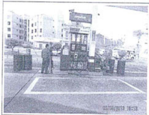
Fotografía 4. Recipientes conteniendo aceite para vehículos y para su expendio, ubicados a un lado de la isla de combustibles líquidos de la estación de servicios