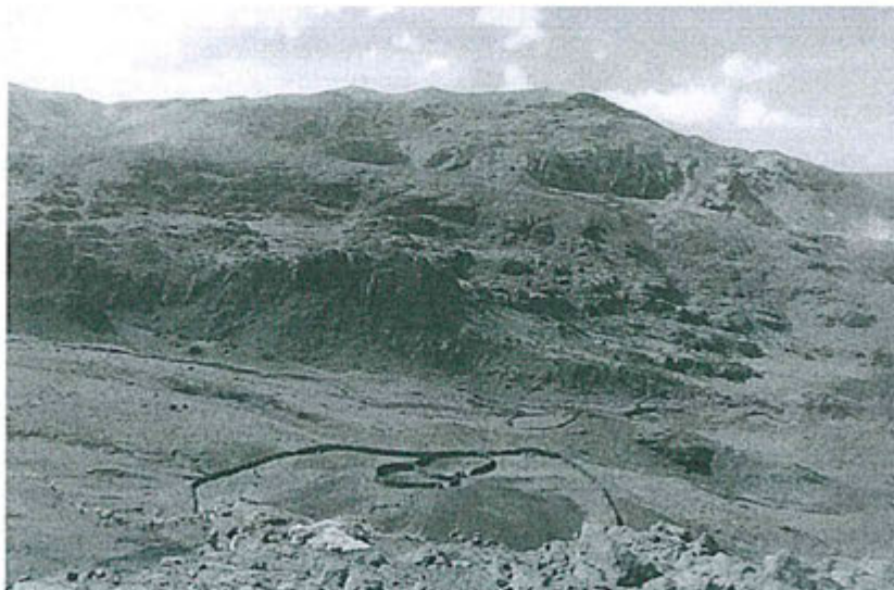
Fotografía N° 41: Hallazgo N° 16; Vista panorámica del área del proyecto, no existe depósitos de top soil (material orgánico) lo que indica que la capa orgánica desbrozada para la construcción de las plataformas, accesos y otros componentes no han sido conservados.