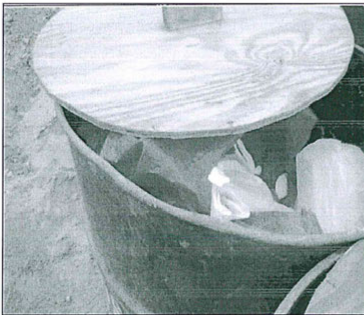
Fotografía N° 1: Almacén Temporal de Residuos Sólidos N° 2 con plásticos en cilindros de residuos orgánicos.