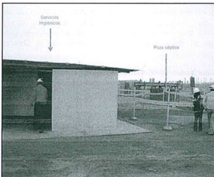
Fotografía N° 4: Se observa el área donde se ubica el pozo séptico al lado derecho de los servicios higiénicos.