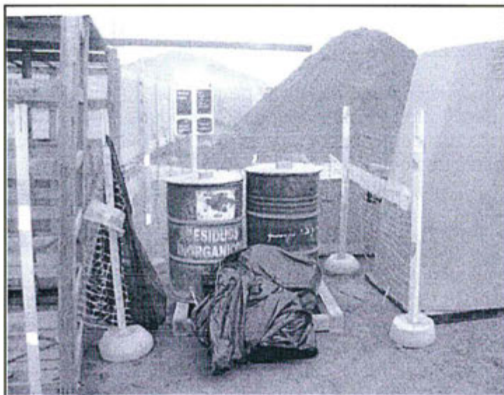
Fotografía N° 3: Almacén temporal de residuos sólidos situado al ingreso del City Gate con bolsas conteniendo residuos fuera de los contenedores.