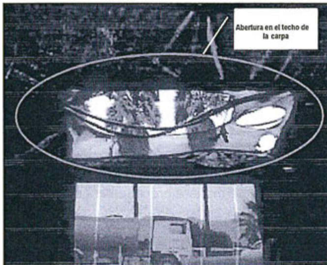
Fotografía N° 5: Vista interior del área de actividades de granallado con el techo deteriorado.