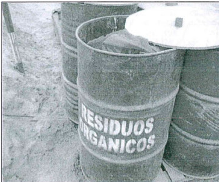
Fotografía N° 2: Almacén Temporal de Residuos Sólidos N° 2 con plásticos en cilindros de residuos orgánicos.