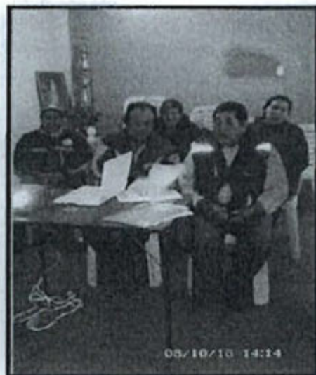
Fotografías 1 y 2: Capacitación del día 8 de octubre de 2015 (Folio 96)