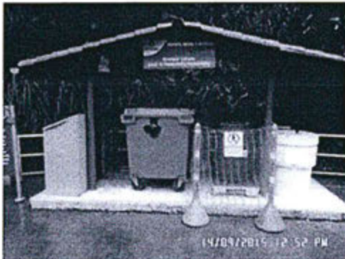
Imagen 1. Fotografía de la vista frontal del módulo de segregación tomada el 14 de setiembre de 2015, a las 12:52 pm, con coordenadas: N 8763385 y E0449091.