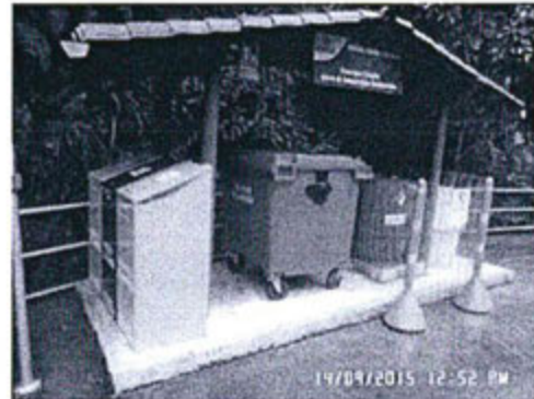
Imagen 2. Fotografía de la vista frontal del módulo de segregación tomada el 14 de setiembre de 2015, a las 12:52 pm, con coordenadas: N 8763397 y E0449080.