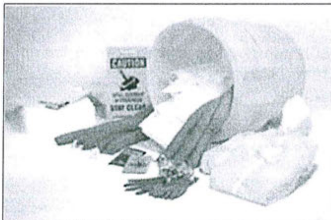
Imagen 4. Modelo del kit antiderrame