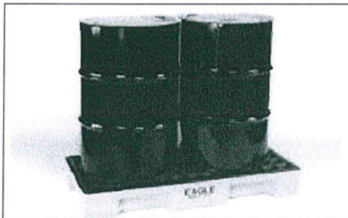
Imagen 3. Modelo de bandeja de Polietileno de Alta Densidad (PEAD)