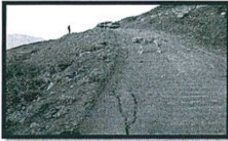
Foto 56: Se observa grietas profundas en la vía de acceso que conduce a los sondeos AE-IDA-DDH-08-15, AE-IDA-DDH-08-08 y AE-IDA-DDH-07-14 (Plataforma N° 4).