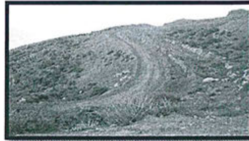
Foto 58: Se observa desprendimiento de material del talud en distintos tramos de la vía de acceso hacia el sondeo AE-IDA-DDH-08 (Plataforma N° 6).