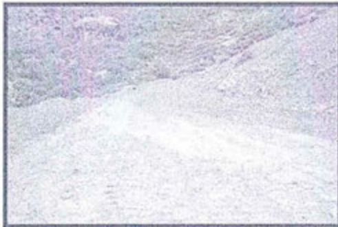
Foto 98: Se observa grietas en el área destinada para el nuevo depósito de mineral.