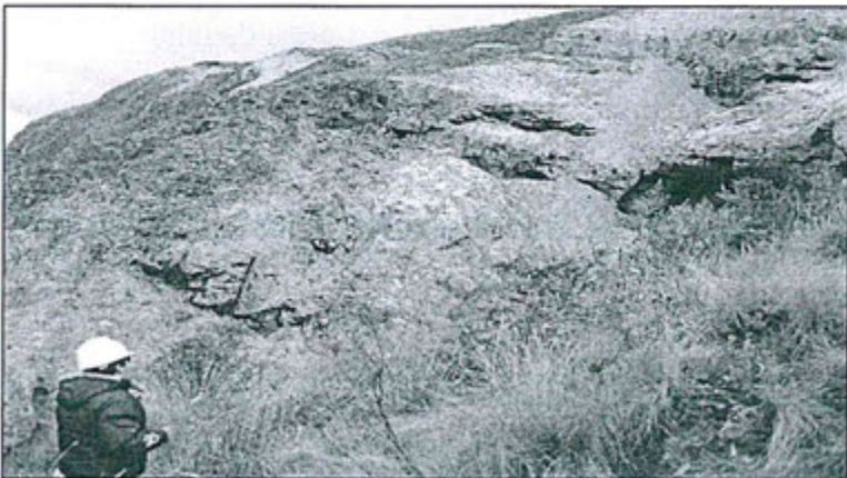
Fotografía N° 39.- Ocurrencia de derrame desde la relavera 3, se observa en la parte baja cerca al río, material derramado impregnado en la roca.