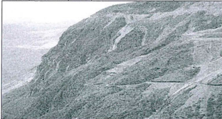
Fotografía N° 38.- Ocurrencia de derrame, se observa la zona del borde inferior del talud con material derramado desde la relavera 3.