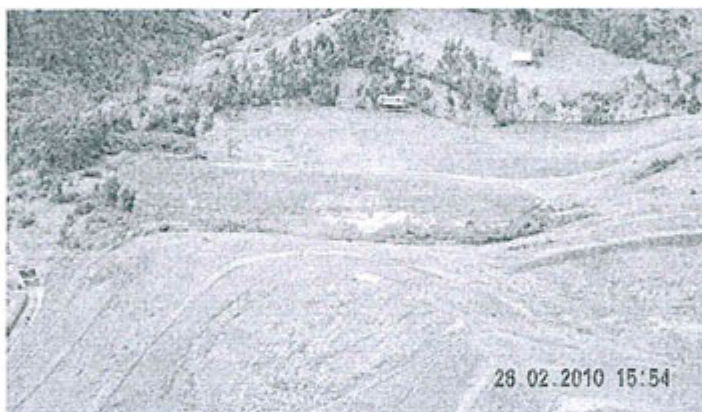
FOTOGRAFÍA No. 47.-Vista panorámica del cuerpo del depósito de relaves No. 5, se aprecia, configuración regular, condición estable, existencia de canal circundante, vegetación incipiente con sectores descubiertos y pequeños charcos de agua en el cuerpo.