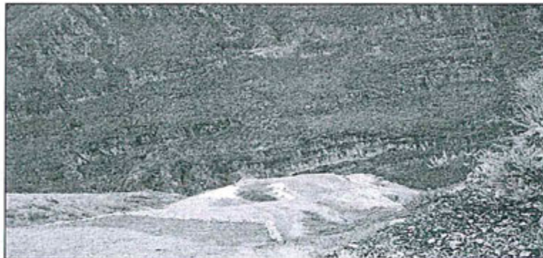
Fotografía N° 37.- Ocurrencia de derrame desde la relavera 3, se observa en la parte baja relaves en proceso de recuperación (traslado mediante bolsas blancas).