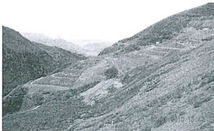
FOTOGRAFIA NO. 1.- Depósitos de relaves No.1, No. 2, No. 3 y No. 4, revegetados, sector EL DORADO.