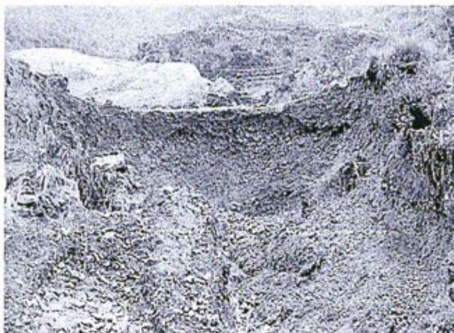
Fotografía N° 02.- Vista del depósito de desmonte de mina con el material erosionado y acarreado al río (A la altura de la cinta se ubica la bocamina)