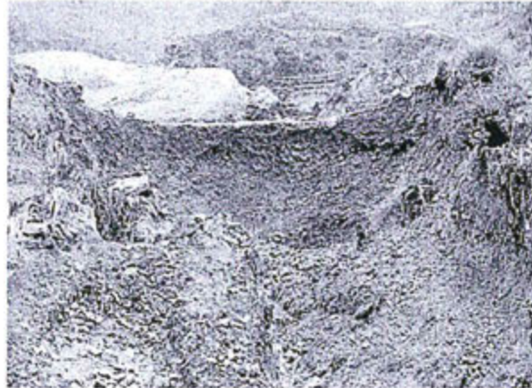
Fotografía N° 02 - Vista del depósito de desmonte de mina con el material erosionado y acarreado al río (A la altura de la cinta se ubica la bocamina)