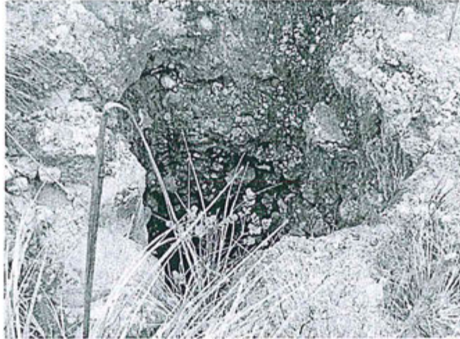
Fotografía N° 10. - Abertura superficial de la chimenea que es un peligro por no tener ninguna medida de protección en resguardo de personas y animales