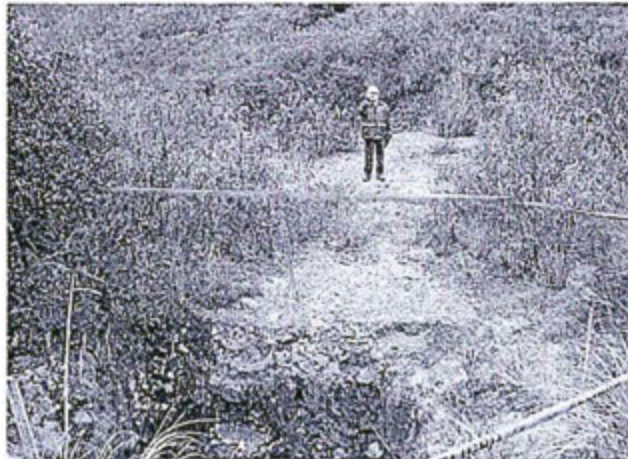
Fotografía N° 09.- Chimenea emplazada muy cerca del río Michiquillay; se observa una reciente colocación de cinta de seguridad