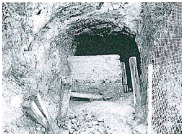
Fotografía N° 03 - Bocamina Michiquillay por donde salió el agua, se observa un muro de tapial como único elemento de cierre que no cubre el total del área de la bocamina