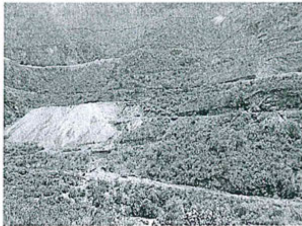
Fotografía N° 01. - Panorámica de lugar de ocurrencia ambiental se observa el depósito de desmonte y el área erosionada con acarreo de material al río