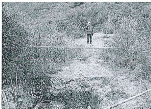
Fotografía N° 09.- Chimenea emplazada muy cerca del río Michiquillay; se observa una reciente colocación de cinta de seguridad