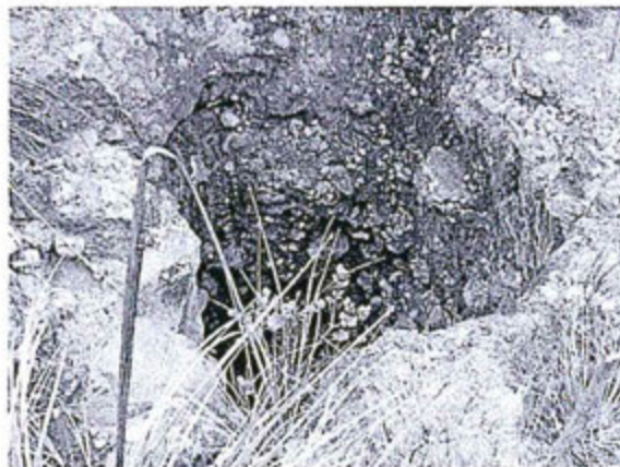
Fotografía N° 10 - Abertura superficial de la chimenea que es un peligro por no tener ninguna medida de protección en resguardo de personas y animales