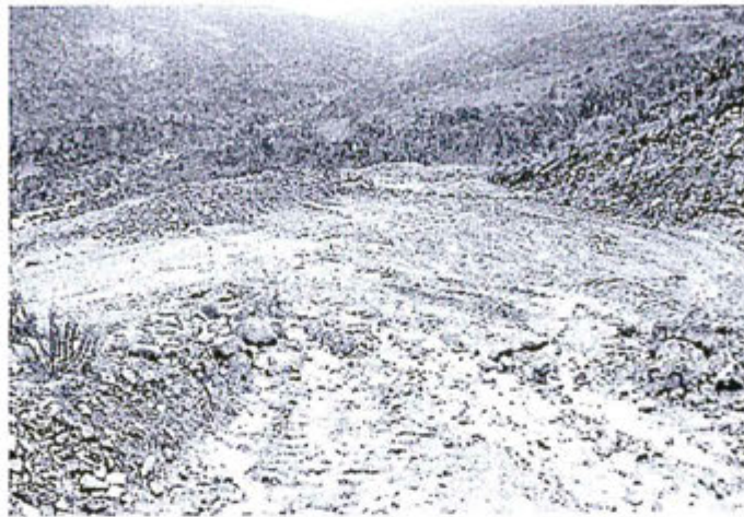
Fotografía N° 12 - Trabajos recientes (Después del evento), realizados por Anglo American Michiquillay SA consistentes en limpieza de cunetas y canalización de escorrentías