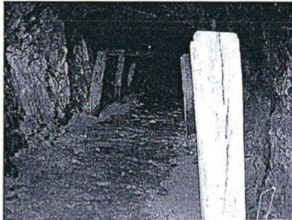
Fotografía N° 04.- Vista interior de la galería por la cual discurrió el agua (se observa el piso con bastante barro y materiales acarreados desde superficie)

Resolución Directoral N° 340-2016-OEFA/DFSAI Expediente N° 266-2013-OEFA/DFSAI/PAS