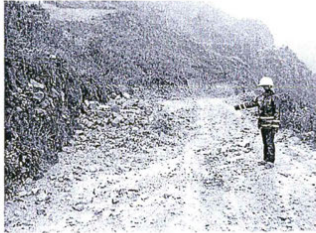
Fotografía N° 11 - Cunetas sin mantenimiento completamente colmatadas de sedimentos y derrumbes de laderas