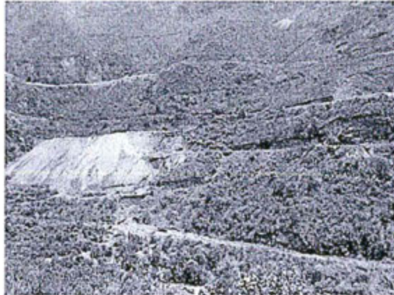
Fotografía N° 01 - Panorámica de lugar de ocurrencia ambiental se observa el depósito de desmonte y el área erosionada con acarreo de material al río