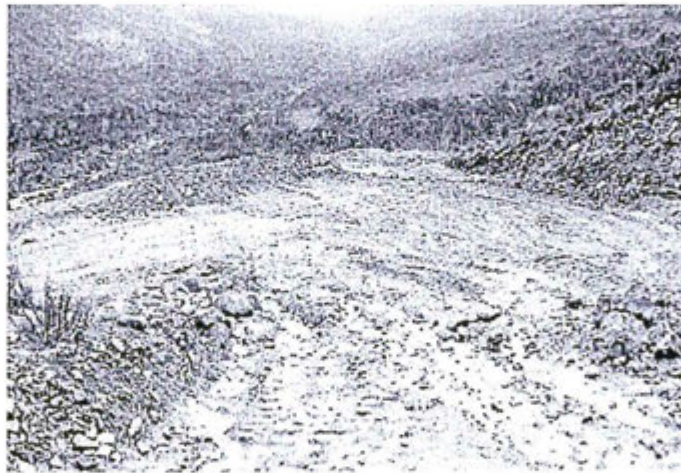
Fotografía N° 12 - Trabajos recientes (Después del evento), realizados por Anglo American Michiquillay SA consistentes en limpieza de cunetas y canalización de escorrentías