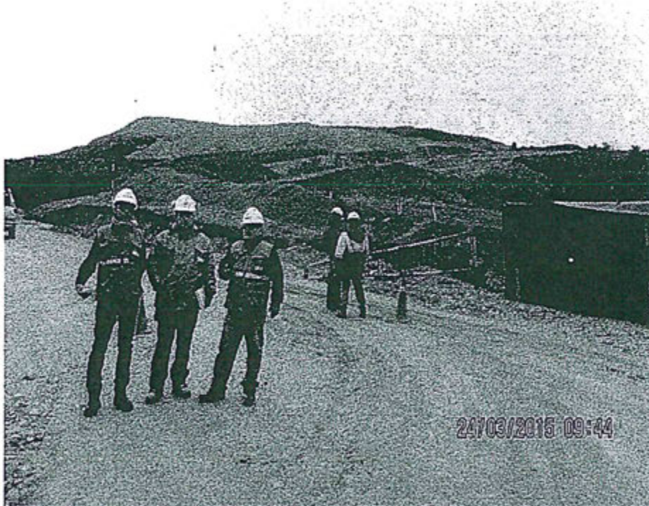
Fotografía N° 3: Garita de control de la unidad minera el Toro, vista de los supervisores, quienes solicitaron la participación de la Policía Nacional del Perú (PNP) para la constatación policial del impedimento de ingreso de los supervisores de OEFA a la unidad minera el Toro.