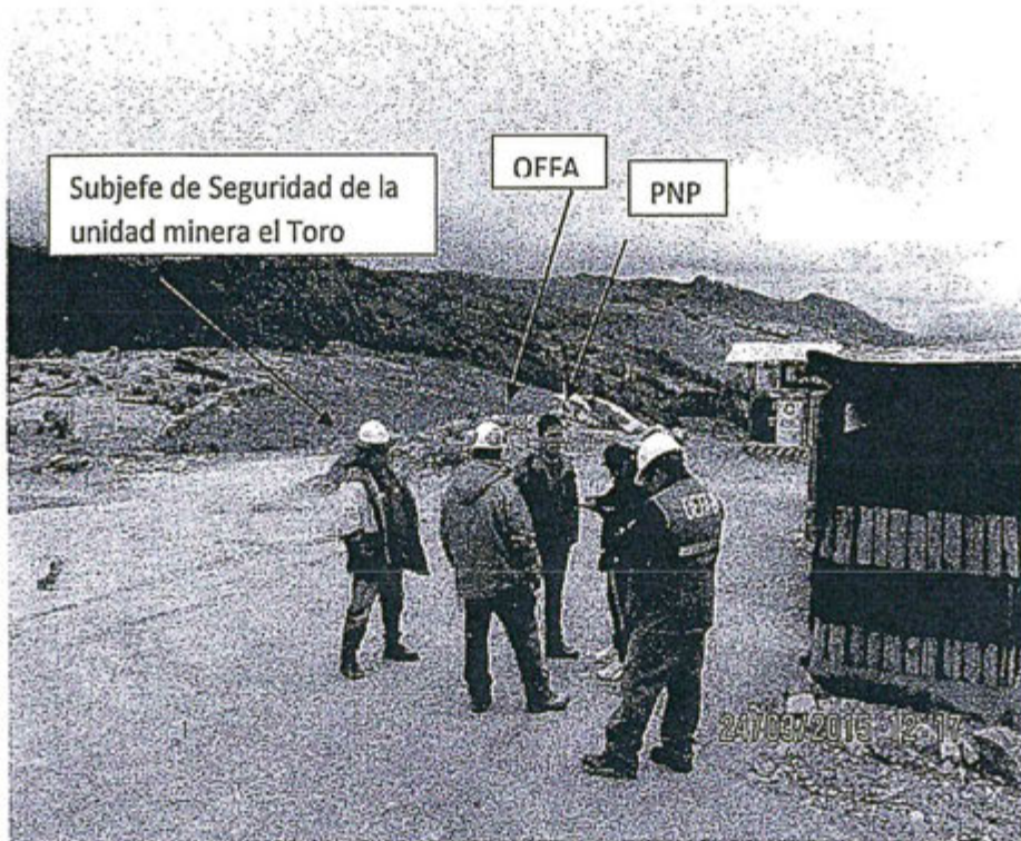
Fotografía N°5: Reunión entre el subjefe de seguridad de la unidad minera El Toro en la zona de la garita de control de ingreso a la unidad minera.