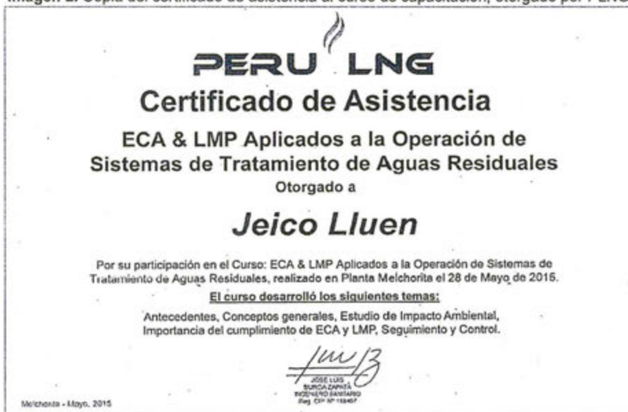
Fuente 1. Escrito con registro N° 44121, presentado por PLNG el 28 de agosto de 2015