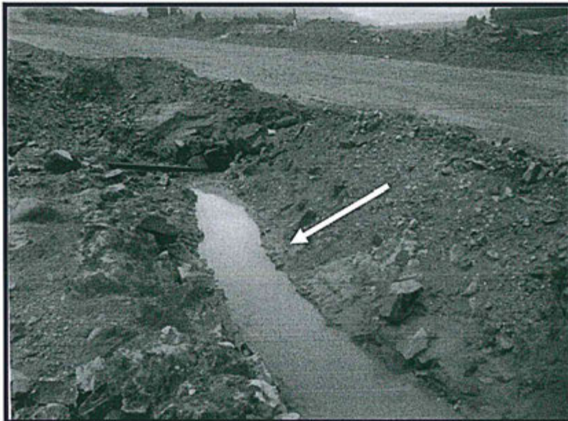
Fotografía N° 19: Canal de derivación de agua de la poza del subdrenaje N° 5 al río Suro, no tiene impermeabilización y se encuentra colmatado de sedimentos.