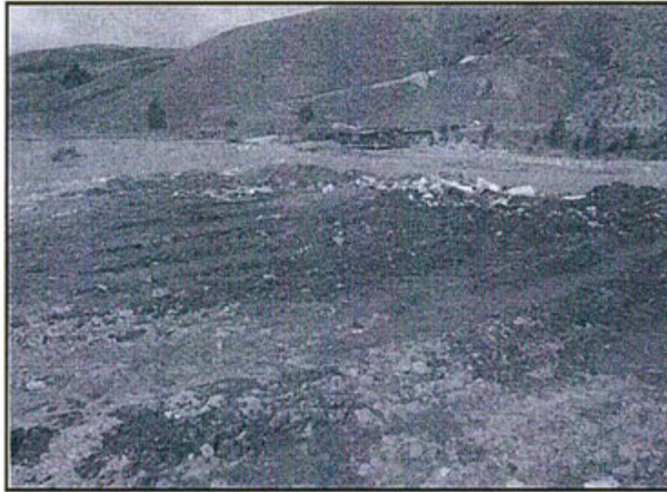
Fotografía N° 28: Celda de relleno sanitario operativo, no cuenta con geomembrana de impermeabilización