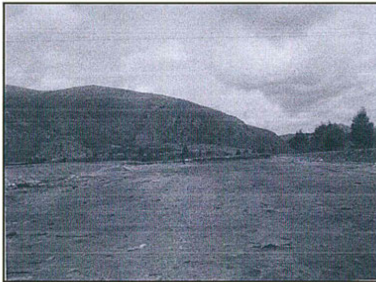
Fotografía N° 29: Celda habilitada del relleno sanitario para la disposición final de residuos sólidos; deberá implementarse una geomembrana