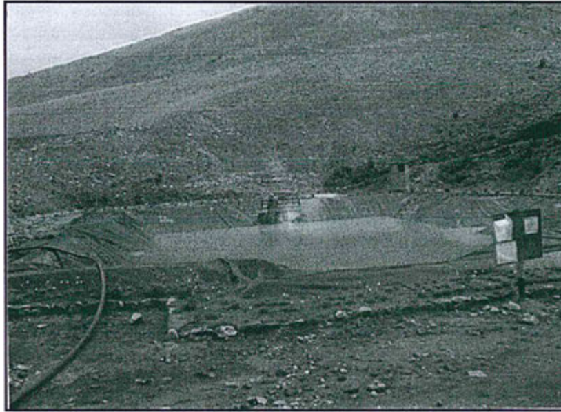
Fotografía N° 18: Talud del banco del pad N° 5 de lixiviación y poza de captación de subdrenos del PAD N° 5.