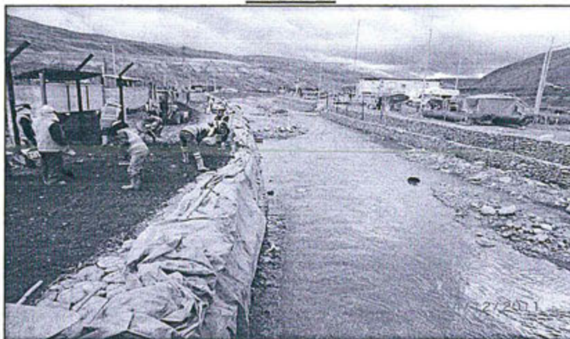
Foto N° 57. Personal de Chinalco trabajando en la protección de las defensas ribereñas del río Yauli.