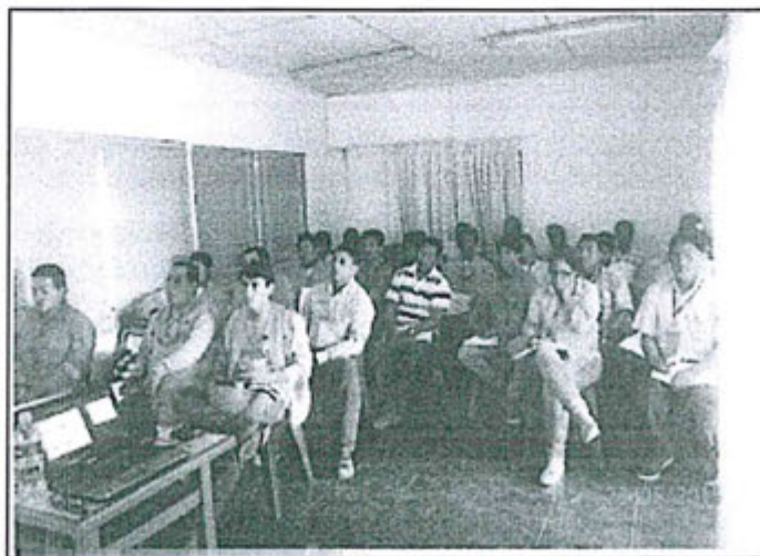
Vista captada durante la realización del curso de capacitación "Manejo de sustancias líquidas peligrosas" llevado a cabo el día 23 de mayo del 2015. Fotografía adjunta al escrito de fecha 27 de mayo del 2015

61. Adicionalmente, BPZ presentó la siguiente visita fotográfica que evidencia la realización del curso de capacitación "Manejo de sustancias líquidas peligrosas" el día 23 de mayo del 2015: