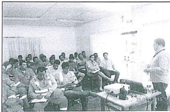
Vista captada durante la realización del curso de capacitación en Gestión de residuos llevado a cabo el día 23 de mayo del 2015. Fotografía adjunta al escrito de fecha 27 de mayo del 2015