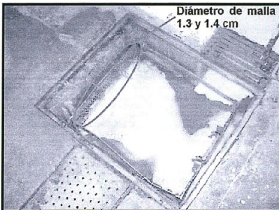
Vista de la trampa de sólidos