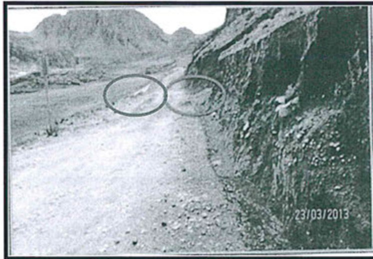
Fotografía N° 10 del Informe de Supervisión: En la vía de acceso al nivel 4458 no se ha realizado el mantenimiento de las cunetas que se encuentran obstruidas.