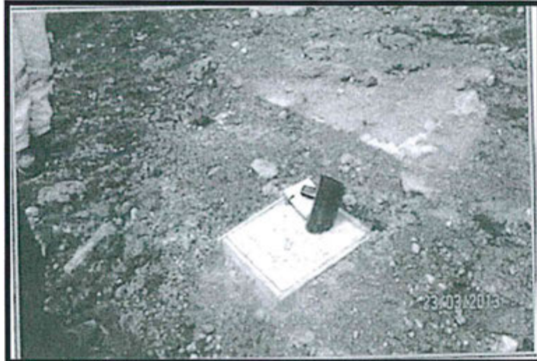
Fotografía N° 18 del Informe de Supervisión: Plataforma detectada que no se encuentra aprobada en los instrumentos de gestión ambiental. Coordenadas UTM WGS 84 293165E, 8831168N