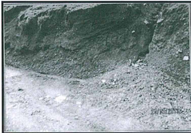
Fotografía N° 11 del Informe de Supervisión: Falta de mantenimiento a las vías de acceso al nivel 4458.