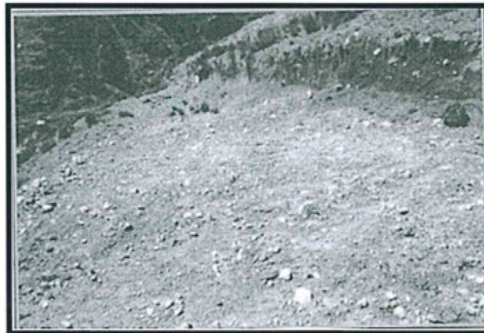
Fotografía N° 13 del Informe de Supervisión: Plataforma 2, sin ninguna identificación y sin el dado de cemento correspondiente al cierre