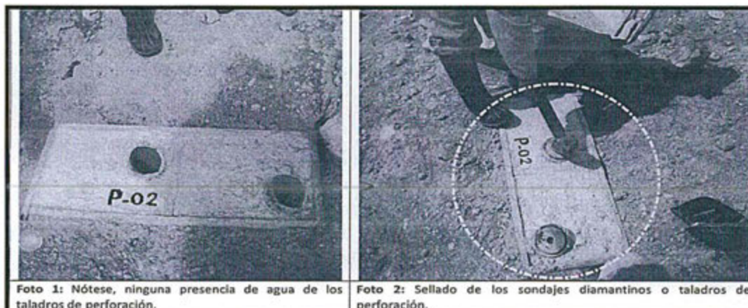
Foto 1: Nótese, ninguna presencia de agua de los taladros de perforación.