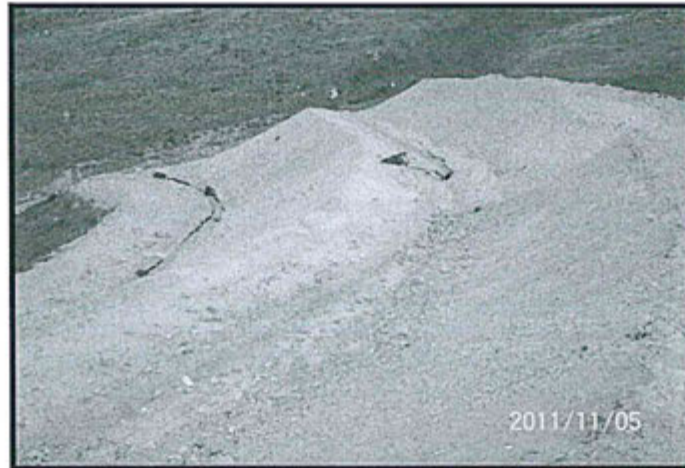
Fotografía N° 45. Depósito de material de corte, cuyos canales colectores al pie de cada banqueta (3 banquetas) están inconclusos y falta de mantenimiento.