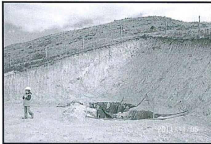
Fotografía N° 16: La plataforma de los sondajes MI09-DH 003/024, carecen de impermeabilización y cerco de protección para las pozas de lodo. El sondaje DH 003 finalizó el 30.08.2009, con una profundidad 1068 metros y el sondaje DH 024 finalizó el 21.11.2009, con una profundidad 174.65 metros.