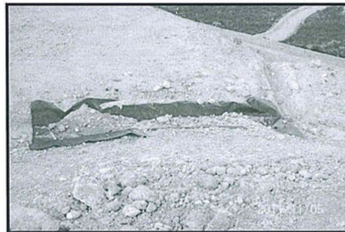
Fotografía N° 49. Los canales perimetrales de escorrentía del único depósito de material de corte, carecen de mantenimiento.