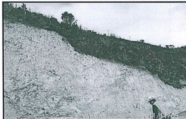
Foto N° 2: El titular minero no ha realizado el cierre de las plataformas de perforación, p.e. la plataforma del Sondaje MI09-DH 002 que fue ejecutada por AK Drilling. Fecha de finalización 01.09.2009, profundidad 1063.63 m.