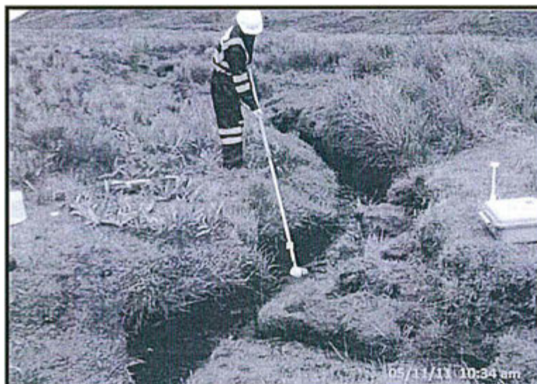
Foto N° 6: No se encontró señalización de la Estación de Monitoreo de Agua Superficial WQM-01.