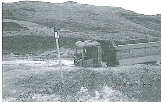
Fotografía N° 008: Evidencia de destrucción de vehículo de carga ubicado al costado de la vía de acceso del Proyecto CONGA