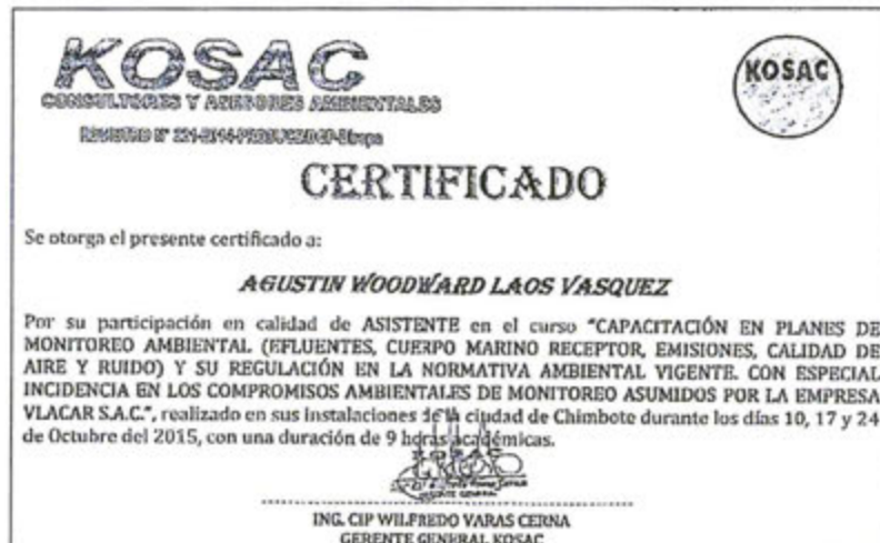
Imagen 1. Copia del certificado de asistencia al curso de capacitación