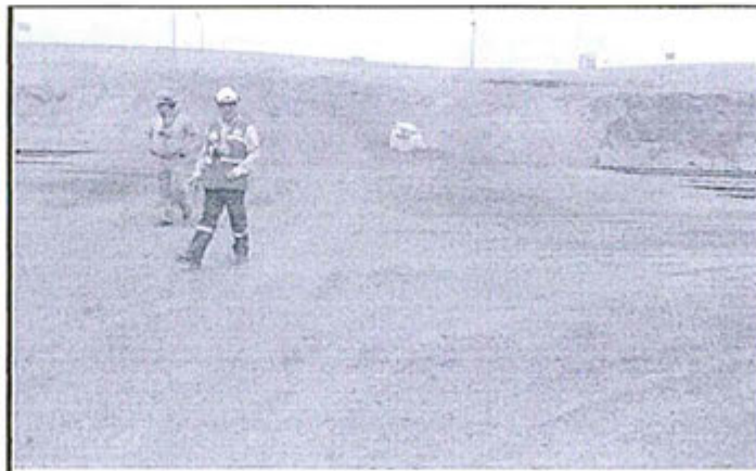
Fotografía N° 12.- Observación N° 06 de la supervisión 2012, en la carretera y línea férrea (cerca a la zona de despacho de ácido sulfúrico), concentrado de plata en suelo natural.

24. Para acreditar lo señalado, la Dirección de Supervisión presentó las fotografías N° 12, 13 y 14 del Anexo 3 "Album fotográfico" del Informe de Supervisión, donde se muestra –según lo indicado por los supervisores– concentrado de plata sobre suelo natural 13 :