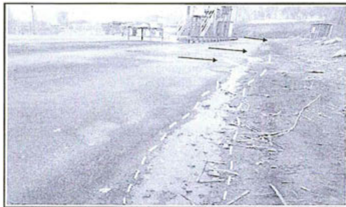
Fotografía N° 07.- Observación N° 03 de la supervisión 2012, residuos de concentrado de zinc, el agua discurre a suelo natural.

22. Cabe indicar que el agua con restos de concentrado de zinc, al entrar en contacto con suelo natural, podría infiltrarse y afectar la napa freática (cuerpo de agua subterránea).