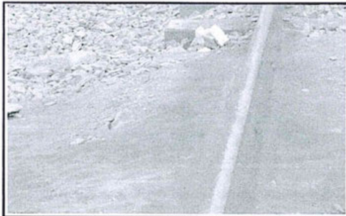
Fotografía N° 13.- Observación N° 06 de la supervisión 2012, en la carretera y línea férrea (cerca a la zona de despacho de ácido sulfúrico), concentrado de plata en suelo natural.