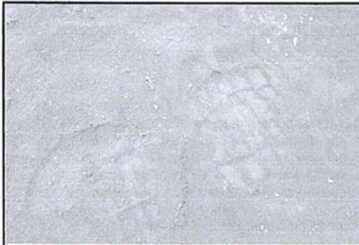
Fotografía N° 14.- Observación N° 06 de la supervisión 2012, en la carretera y línea férrea (cerca a la zona de despacho de ácido sulfúrico), concentrado de plata en suelo natural.