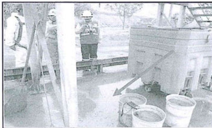
Fotografía N° 06.- Observación N° 03 de la supervisión 2012, residuos de concentrado de zinc, el agua discurre a suelo natural.