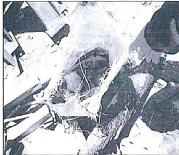
FOTOGRAFIA N° 58: Hallazgo N° 01-2012.- En el almacén temporal se ha observado un saco con contenido de residuos peligrosos (trapos impregnados de grasa) dispuesto sobre tubos y otros materiales.