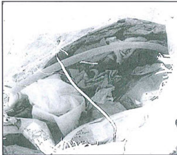
FOTOGRAFIA N° 59: Hallazgo N° 01-2012.- Saco con contenido de residuos peligrosos (trapos impregnados de grasa).