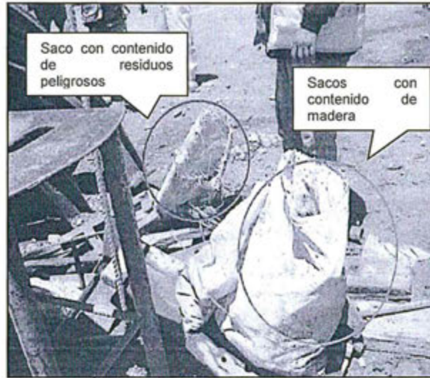
FOTOGRAFIA N° 57: Hallazgo N° 01-2012.- En el almacén se ha observado un saco con contenido de residuos peligrosos (trapos impregnados de grasa) (círculo rojo) y otros sacos con contenido de madera (círculo celeste), ambos dispuestos sobre tubos y otros materiales ubicada en las coordenadas WGS-84: 8314258N, 768741.20 E y 4648.39 m.s.n.m.