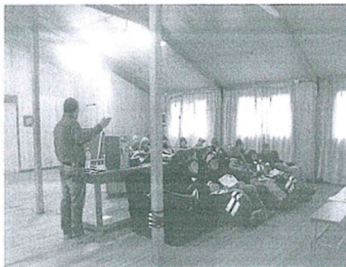
Fotografía 1: Capacitación en la Unidad Minera Quicay (Folio 1478)

34. Por otro lado, sobre los certificados de capacitación y el registro fotográfico presentado, la DFSAI considera que estos constituyen elementos adicionales que sirven para reforzar la acreditación de la concurrencia a la capacitación mencionada. La fotografía se presenta a continuación: