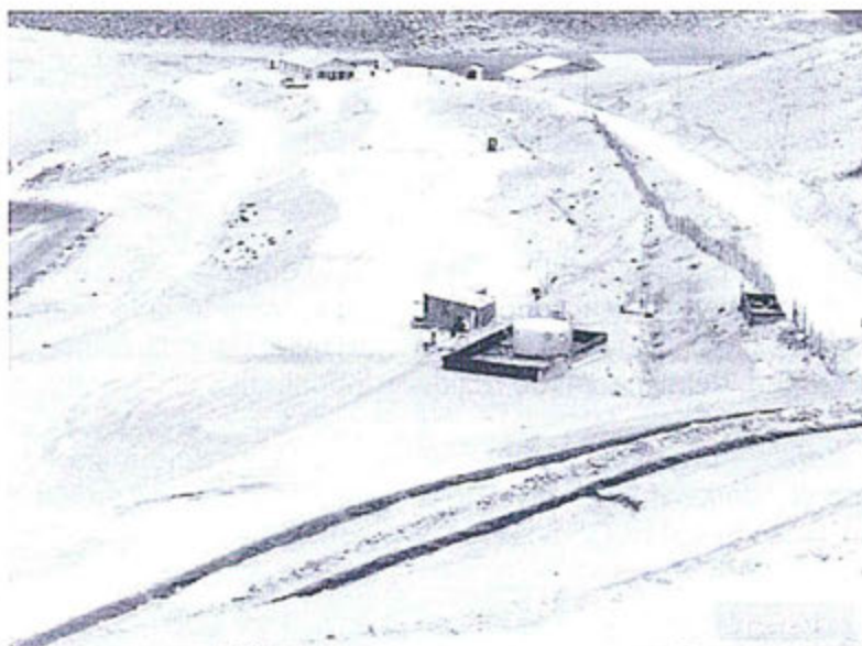
Fotografía N° 2.36: Plataforma de Ex – Casa fuerza.

65. De otro lado, Aruntani indica que los residuos metálicos encontrados son considerados como recuperables pues son materiales excedentes de los trabajos de demolición y desmontaje (tuberías, calaminas y tijerales), los cuales son acondicionados en un lugar alejado de cuerpos de agua, bofedales y áreas con cobertura vegetal. Además, indica que la Fotografía N° 2.36 del Informe de Supervisión muestra que la ex Casa Fuerza se encontraba en proceso de desmantelamiento, siendo que los materiales observados son los que corresponden a esta labor 37 :