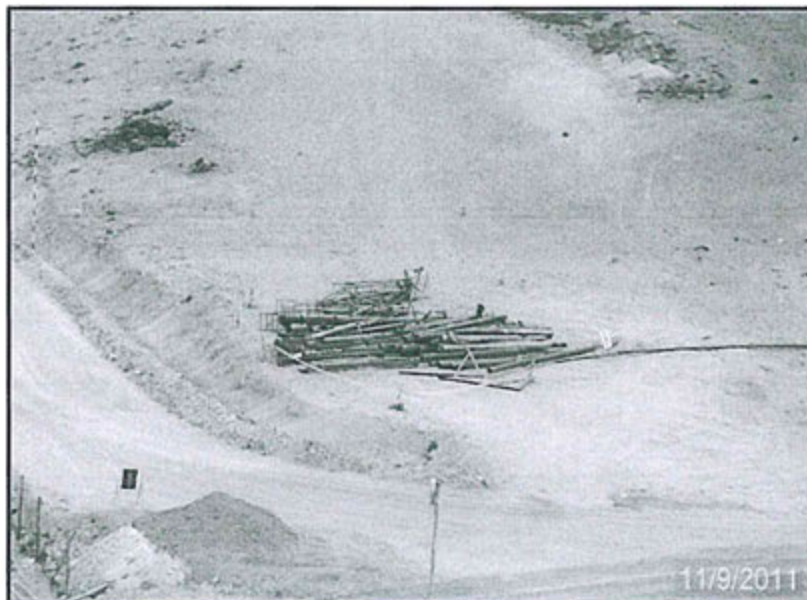
Fotografía N° 2.31: Sectores no apropiados para almacenaje de residuos industriales.