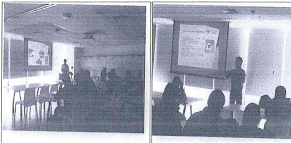
Vistas captadas durante la realización del curso de capacitación "Gestión de Residuos Sólidos". Fotografías adjuntas al escrito de fecha 15 de diciembre del 2014