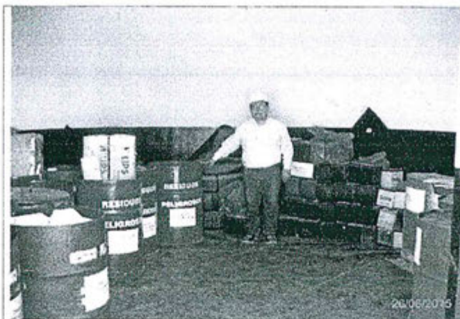
Foto N° 02.- Almacén A-2 de Residuos Peligrosos – Rotulado de los cilindros