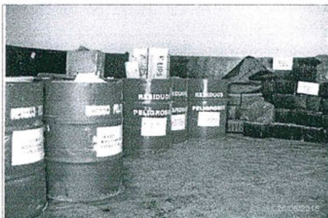
Foto N° 03.- Almacén A-2 de Residuos Peligrosos – Rotulado de los cilindros