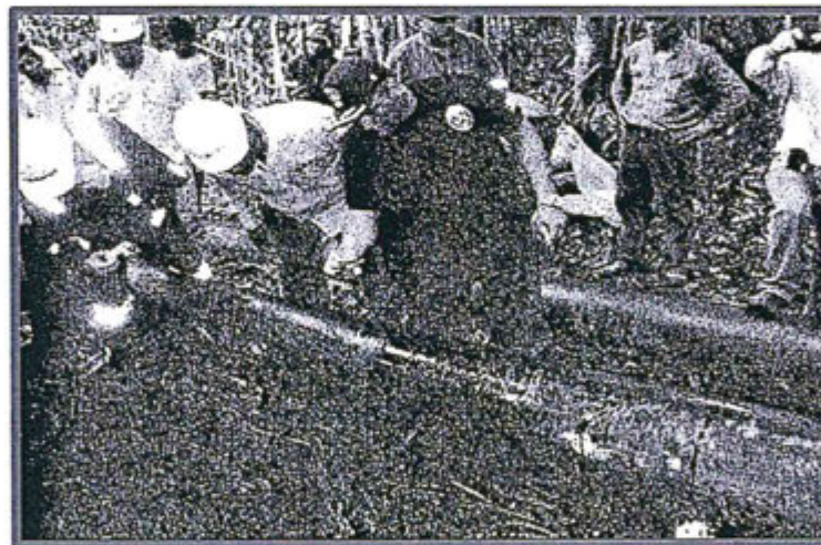
Fotografía N° 6