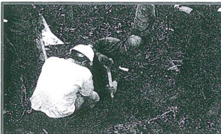
Fotografía N° 3

Calicata para extracción de muestras de suelo afectado por el derrame de petróleo en el Oleoducto B (Km 30+875)