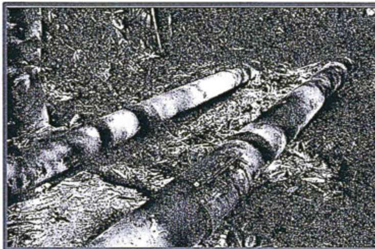
Fotografía N° 1

Vista de grapas colocadas en zona donde fue cortado el Oleoducto B (Km 30+875)