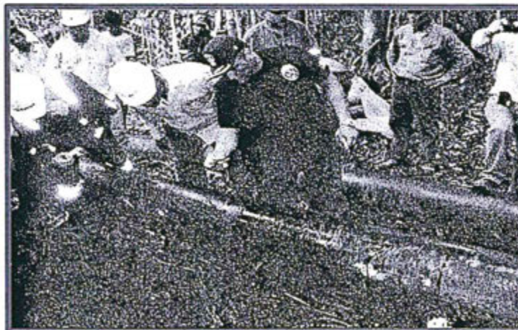
Fotografía N° 2

Vista de grapas colocadas en zona donde fue cortado el Oleoducto B (Km 30+875)