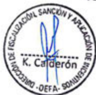
Cuadro N° 2