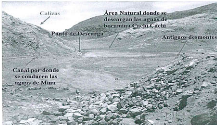
Foto N° 48: Descarga del efluente de la Bocamina Cachi Cachi – Nivel 410 en un área natural (depresión).