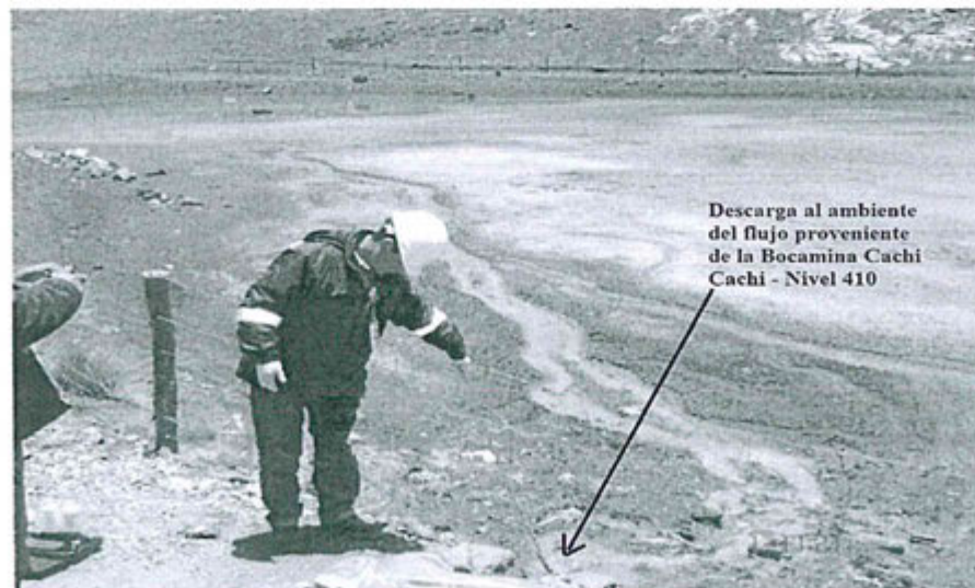
Foto N° 50: Punto de descarga del efluente de la Bocamina Cachi Cachi – Nivel 410 hacia una depresión natural.