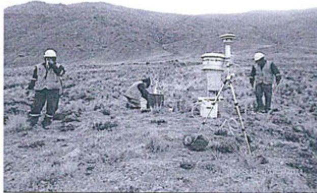
Fotografía N° 18: Punto de control CA-1 ubicado a 900m noreste de la laguna Llampuma entre el cerro Llampuma.