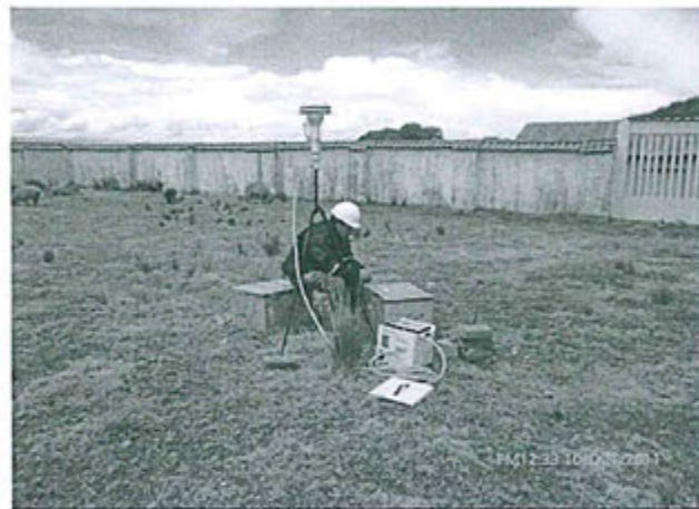
Fotografía N° 21: Punto de control A-2 ubicado en el centro médico del poblado de Cupi.