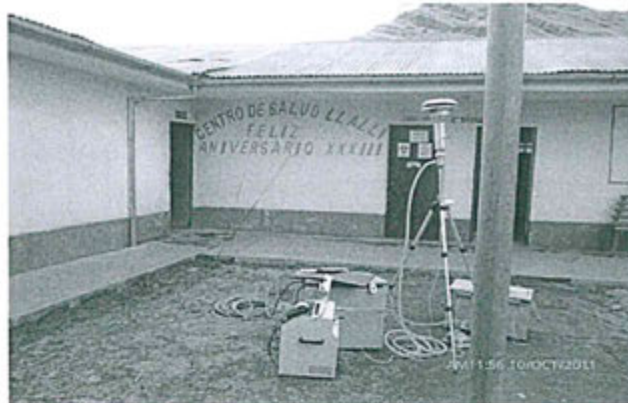
Fotografía N° 20: Punto de control A-1 ubicado en el centro médico del poblado de Llalli.