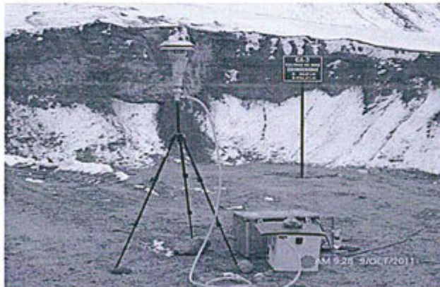
Fotografía N° 19: Punto de control CA-3 ubicado en el cerro Lluchusani.