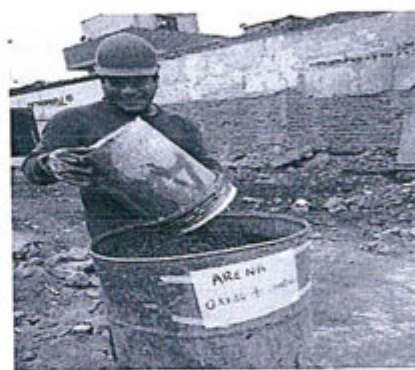
Fotografía N° 4: Almacenamiento Temporal de tierras contaminadas

Disposición temporal de tierras contaminadas con hidrocarburos, el color de cilindro es azul y no rojo como refiere Plan de Abandono