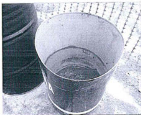
Fotografía N° 3: Vertido de contenido sobre cilindro de borras

Combustible remanente que fue vertido a uno de los cilindros negros que se encontraba lleno en un 50%