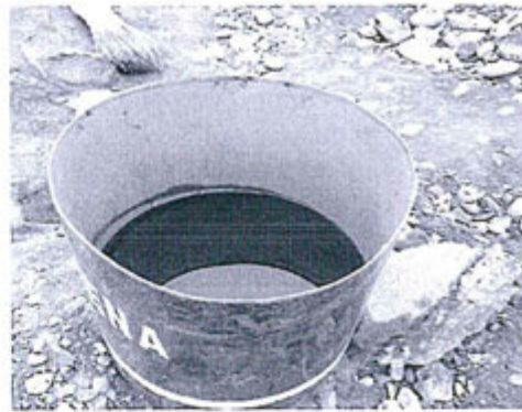
Fotografía N° 2: Disposición temporal de residuos peligrosos

Tanque con combustible residual, con rotulo arena, si tapa