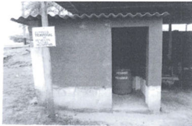
Foto 3. Almacén de Residuos Sólidos Peligrosos remodelado octubre 2014.