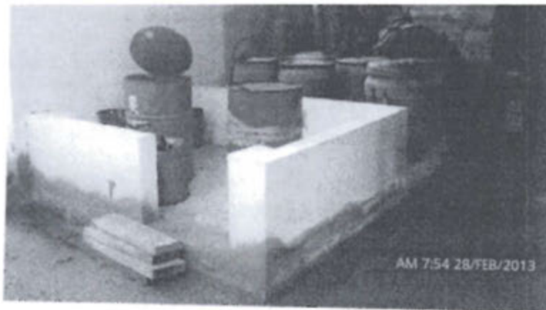
Foto 1. Almacén de Residuos Sólidos Peligrosos construido en febrero del 2013.