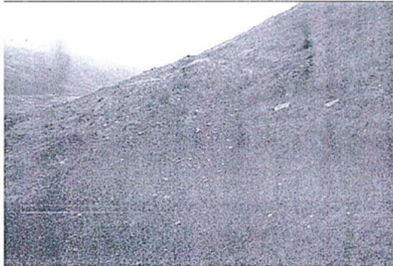
Fotografía N° 17. Vía de acceso a plataforma CS-DDH-04 – Cocha Sur