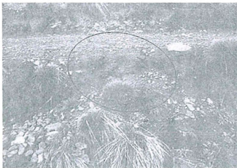
Fotografía N° 14. Zona de derrumbe en el acceso a plataforma CS-DDH-02, ubicada en Cocha Sur.