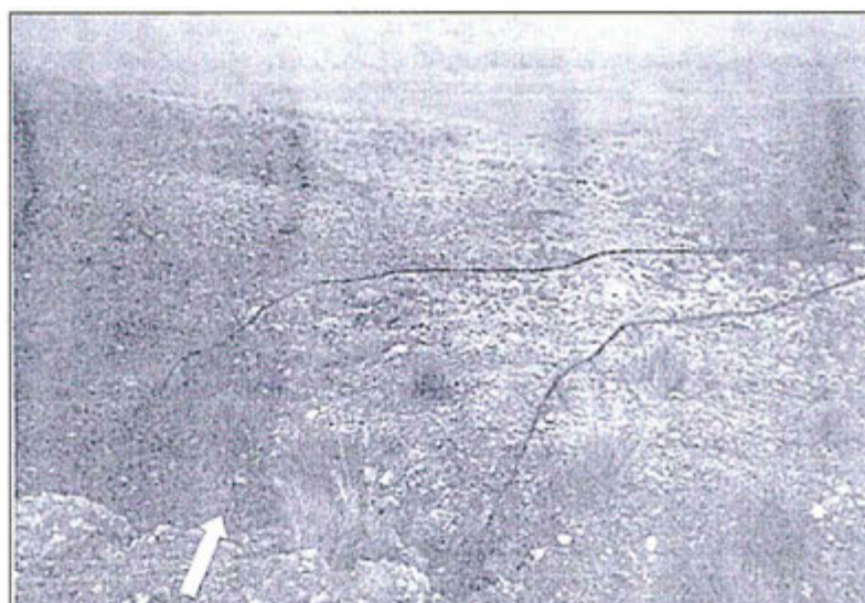
Fotografía N° 15. Poza de sedimentación de la plataforma CS-DDH-02, la flecha muestra la zona erosionada por la escorrentía. Observación N° 2 – Supervisión Especial 2011.