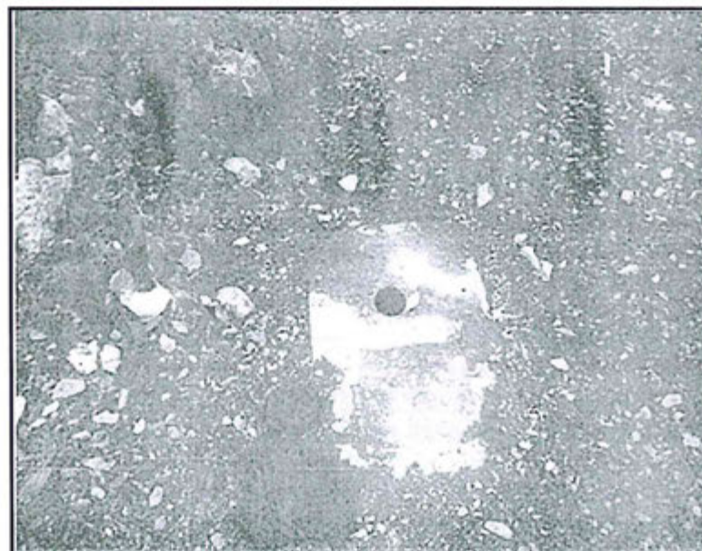
Fotografía N° 23. Plataforma antigua con sondaje (CO.06.03) en Cocha Centro.