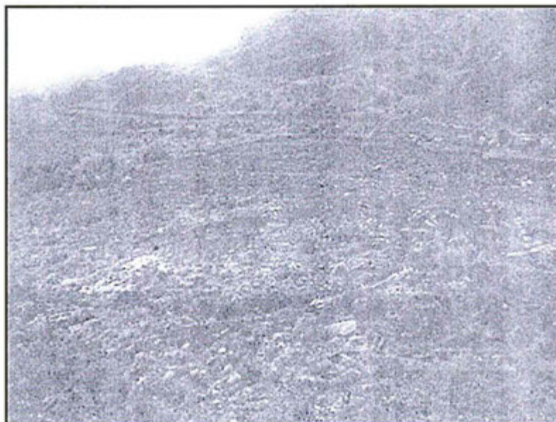
Fotografía N° 24. Plataforma antigua con sondaje CO.06.03 en Cocha Centro.