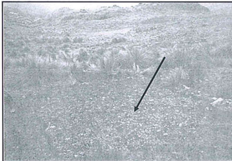
Fotografía N° 9. Poza de sedimentación nivelada, el cual constituye uno de los pasivos ubicados en el Proyecto Cocha.

115. En el Informe de Supervisión obran las Fotografías N° 9, 23 y 24 52 que conforme a lo expuesto en la Resolución Subdirectoral supuestamente evidenciarían lo indicado en la Observación N° 8: