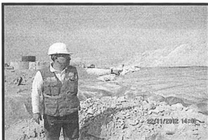
Fotografía N° 55 de la Supervisión realizada en noviembre del 2012, donde se verifica que se ha impermeabilizado el área donde se disponen los residuos sólidos. Además, la Supervisora señala que se han retirado los materiales dispuestos temporalmente