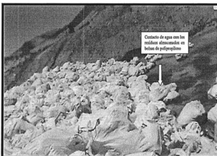
Fotografía N° 12: "Se puede apreciar la humedad del suelo debajo de la disposición de residuos".