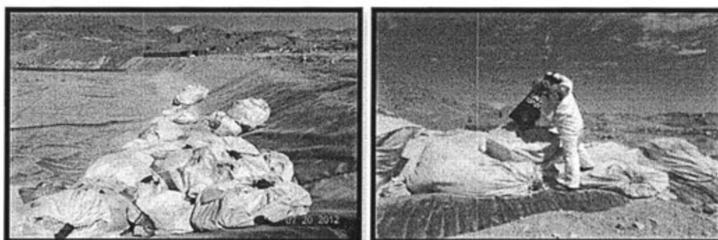
Fotografías que muestran la zona donde se dispone actualmente los residuos sólidos no peligrosos

35. En el escrito de descargos presentado el 9 de agosto del 2013, es decir con posterioridad a la Supervisión Especial 2012, Cerro Verde señaló que implementó un área impermeabilizada donde actualmente se disponen los residuos comunes no peligrosos y que, adicionalmente, ha clausurado la antigua infraestructura de disposición de residuos sólidos. Presenta las siguientes fotografías a efectos de acreditar lo señalado: