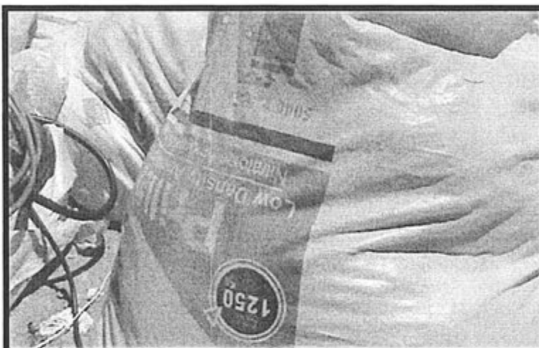
Fotografía N° 10: "Residuos comunes provenientes de las operaciones mineras almacenados en bolsas de polipropileno".