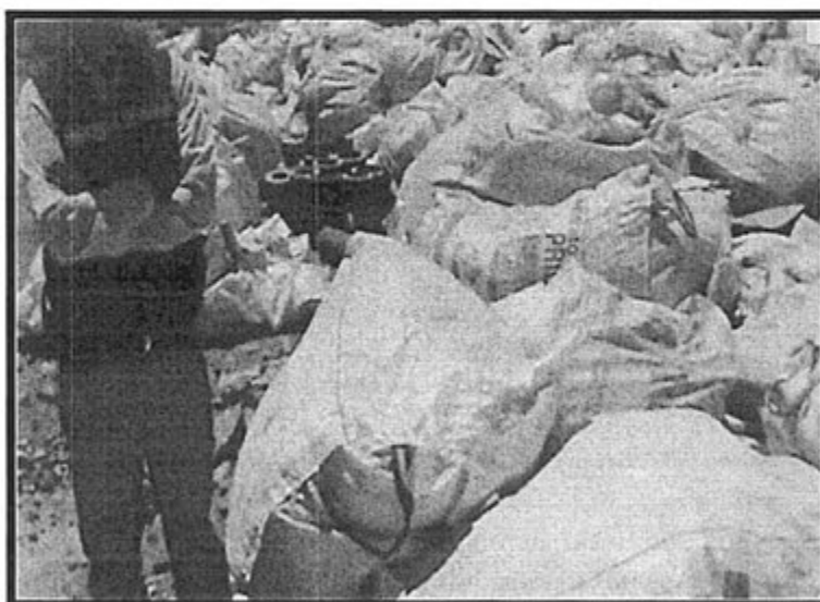
Fotografía N° 11: "El almacén de los residuos comunes no cuenta con una base impermeabilizada, necesario por la presencia de agua en contacto con dichos residuos".