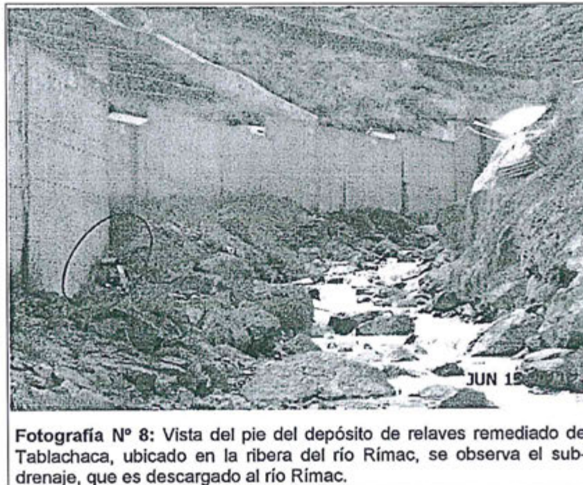
Fotografía N° 8: Vista del pie del depósito de relaves remediado de Tablachaca, ubicado en la ribera del río Rímac, se observa el sub-drenaje, que es descargado al río Rímac.