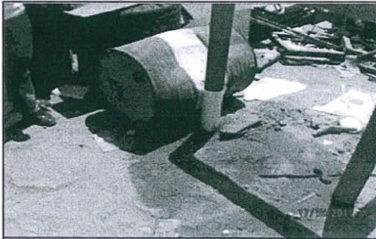
Fotografía N° 8: Suelo con hidrocarburos

Se muestra suelo contaminado con hidrocarburo como consecuencia de escurrimiento de un cilindro donde estaban dispuestos residuos líquidos peligrosos. Coordenadas E: 489233, N: 9437654