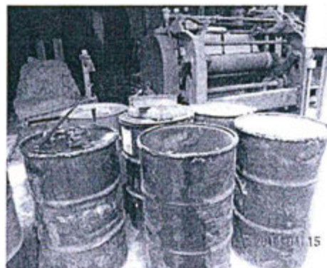
Fotos N° 4 y N° 5: Áreas de acopio de residuos sólidos peligrosos (Envases de pinturas y Cilindros de aceite)

30. De acuerdo a los medios probatorios citados y a lo señalado por la Dirección de Supervisión, se concluye que durante la supervisión efectuada el 15 de abril del 2014, Curtiembre Cuenca no contaba con un almacén central para el acopio de los residuos sólidos peligrosos generados en la Planta La Esperanza.