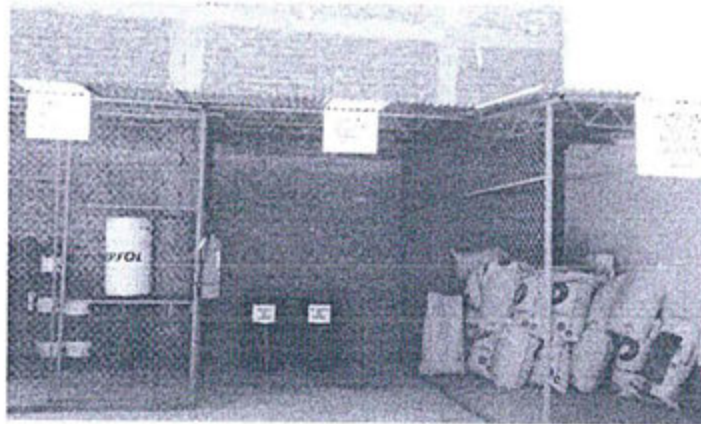
Fotografía N°2: Área de Almacenamiento temporal de Residuos sólidos Peligrosos y Área de Almacenamiento temporal de residuos Orgánicos no Peligrosos