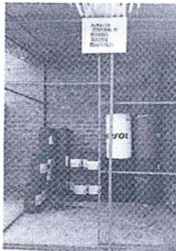
Fotografía N°1: Área de Almacenamiento temporal de Residuos sólidos Peligrosos