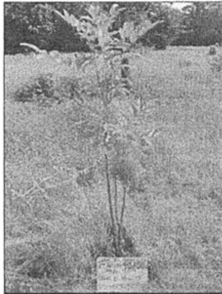
Fotografía N° 5 Campamento Sub base "El Pobrecito" - Reforestación

Se aprecia un plantón de "mari mari", único individuo sobreviviente de la primera reforestación realizada en el campamento sub base. Coordenada 706615E y 9554546N.