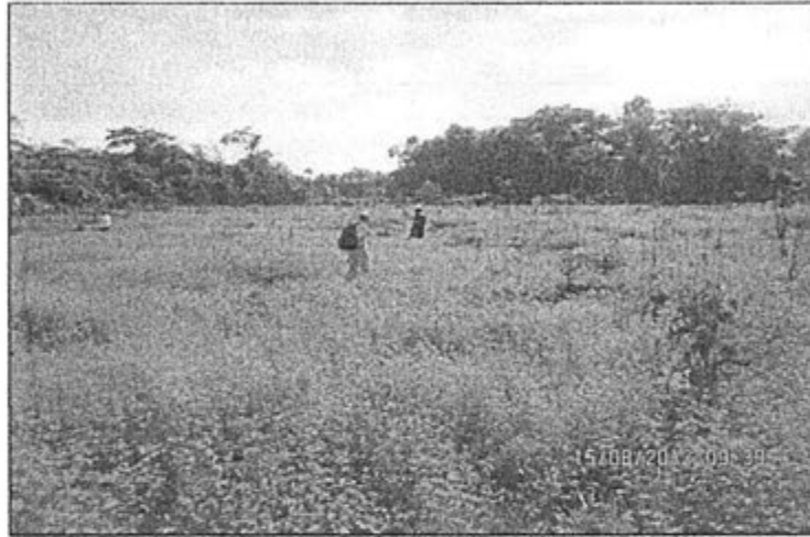
Fotografía N° 5 Campamento Sub Base "El Pobrecito" - Reforestación

La vegetación existente corresponde a la revegetación natural. Se evaluó el número de individuos sobrevivientes de la reforestación realizada. Coordenada 706579E y 9554468N.