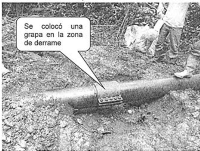
Foto N° 03: Vista panorámica del Oleoducto B con grapa, en la progresiva Km. 60+344 del Oleoducto B Corrientes-Saramuro. La colocación de la grapa en la tubería redujo mayor derrame de crudo sobre el ambiente.