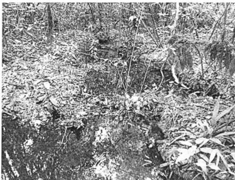
Foto N° 11: Vista panorámica del impacto por crudo derramado a cuerpos de agua receptor. El color del agua ha sufrido cambio de color natural.