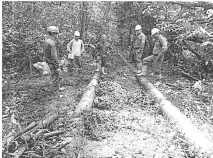
Foto N° 04: El personal de contingencia y autoridades en el punto de derrame de crudo. Se observa tanto el suelo como cubierta vegetal impactado por el derrame de crudo en el derecho de vía.