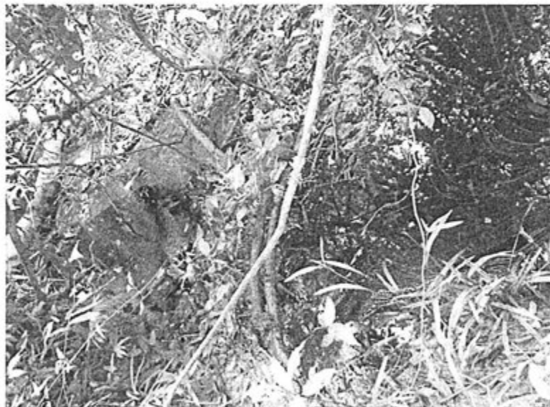
Foto N° 10: Se observa el punto de ingreso de crudo a la quebrada de cauce temporal, sin ningún tipo de contención evite la contaminación de cuerpos de agua.