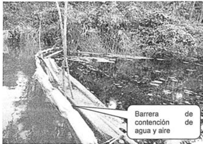
Foto N° 17: Vista fotográfica de la colocación de barrera de contención de agua y aire para respresar el petróleo crudo para su posterior recuperación y evitar la contaminación del río Patuyacu.