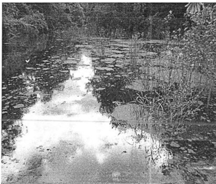
Foto N° 16: Vista fotográfica de la contaminación de la cocha existente a 500 metros del punto de derrame. También se puede observar manchas marrones sobre la superficie del agua, producto de la utilización de absorbentes sobre agua con presencia de crudo.