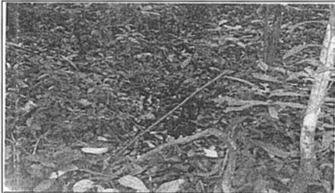
Foto N° 09: Se observa otro lugar impactado, donde se aprecia claramente el petróleo crudo derramado empozado, que ha sido contenido sobre suelo y vegetación del lugar.