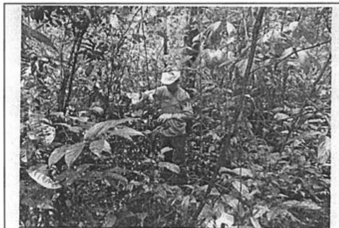
Foto N° 14: Personal de la Dirección de Evaluación del OEFA en pleno muestreo de suelo impactado por el derrame del crudo.