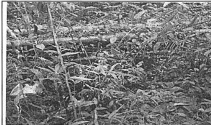
Foto N° 10: Se aprecia la migración del petróleo crudo derramado al lado izquierdo del oleoducto afectado. Aprox. el 40% de crudo derramado ha migrado y depositado en el lugar, esperando la pronta recuperación de crudo y rehabilitación del área afectada.