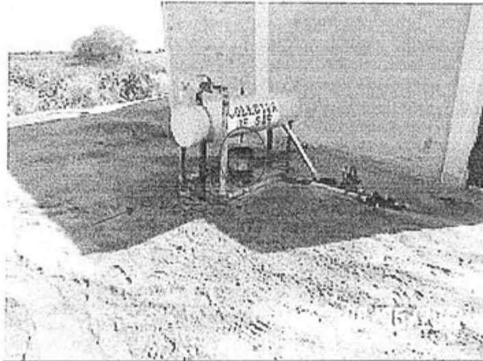
Fotografía N°5: En la Batería N° 2, el colector de gas no cuenta con una adecuada bandeja contenedora.