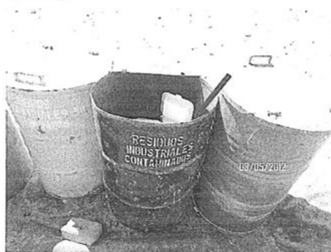
Fotografía No. 1: En la zona de despacho de combustible se observan residuos mal segregados y depósitos sin tapa.