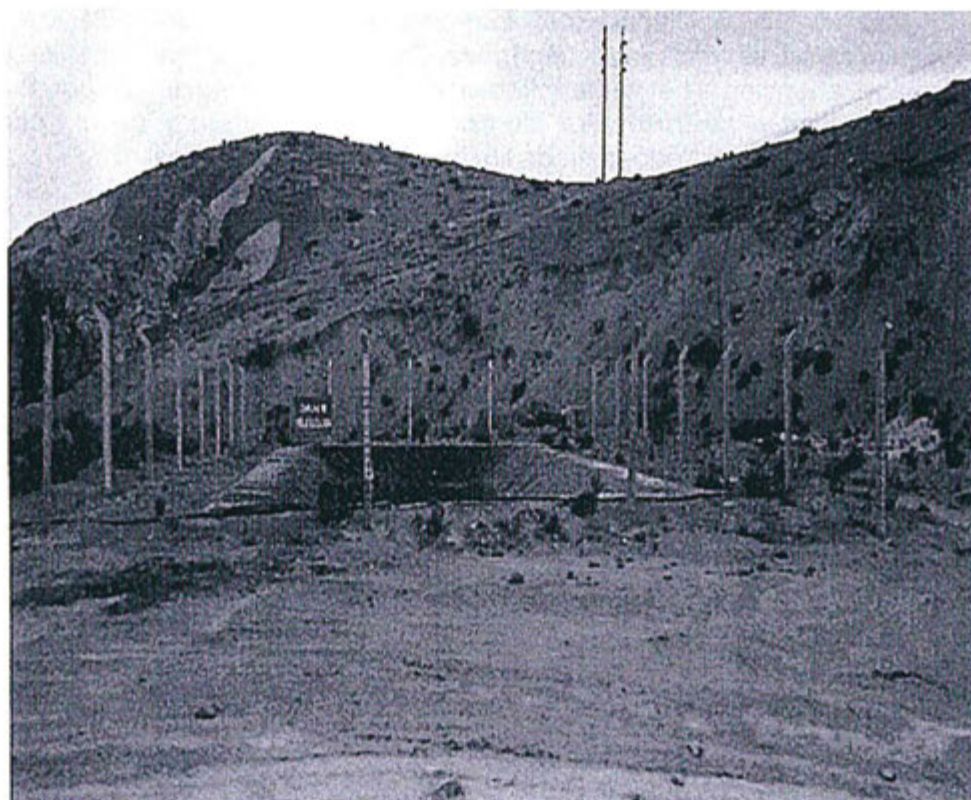
Fotografía N° 2 del Informe de Descargos - Supervisión Regular Unidad Arcata