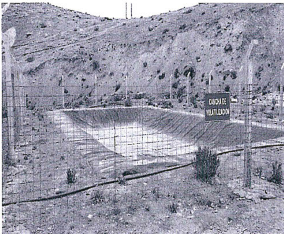
Fotografía N° 1 del Informe de Descargos - Supervisión Regular Unidad Arcata

Expediente N° 089-2012-OEFA-DFSAI/PAS/MI