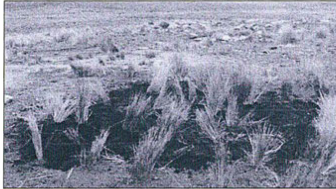
Silo ciego tapado y remediado.