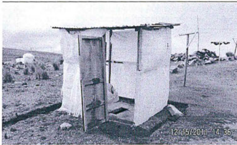
Fotografía N° 51: Silo ciego existente en el Proyecto de Exploración "Jasperoide".