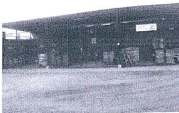
Almacén temporal de residuos peligrosos