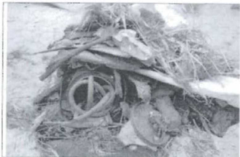
Fotografía N° 2: Vista de residuos sobre suelo natural.