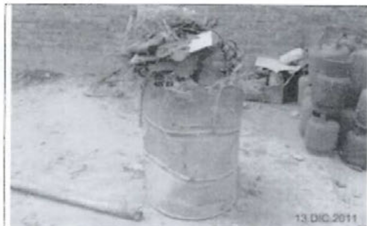
Fotografía N° 1: Vista del almacenamiento de residuos mal segregados, excesivo volumen y no rotulado