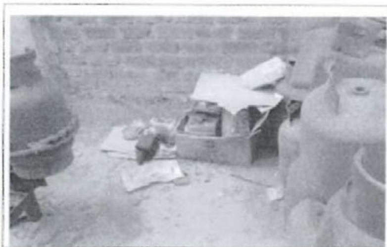
Fotografía N° 3: Vista de residuos almacenados en una caja de cartón (latas de esmalte que sirve para pintar los cilindros de GLP).