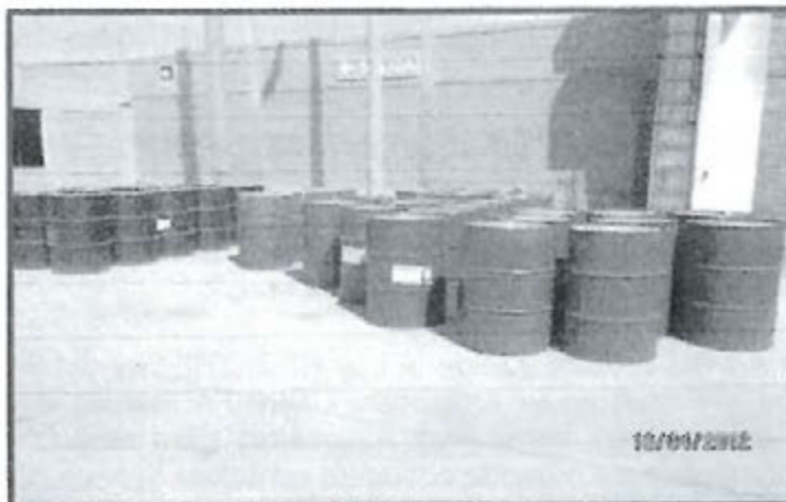
Fotografía N° 3: El Almacén de productos químicos no cuenta con un sistema de doble contención.