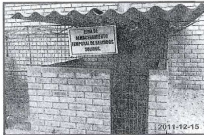
Fotografía N° 6: Almacenamiento temporal de Residuos Sólidos de la Planta Envasadora no cuenta con un sistema contra incendios.