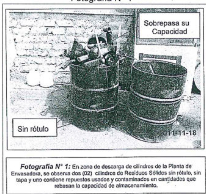
Fotografía N° 1

25. Por Resolución Subdirectorial N° 2086-2014-OEFA/DFSAI/PAS se concedió a Multigas un plazo de quince días a fin de que formule sus descargos; sin embargo a la fecha no ha informado haber subsanado la conducta infractora, pese a haber tenido la oportunidad para hacerlo.