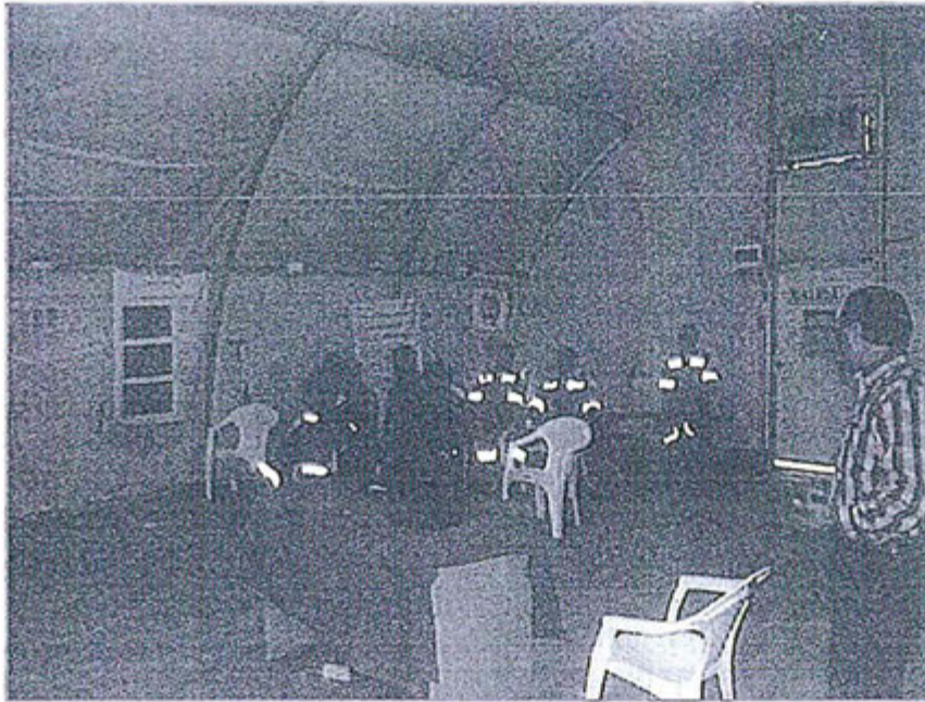
Fotografía N° 2 de la capacitación "La importancia de la correcta dosificación del cloro y su impacto sobre el medio ambiente"