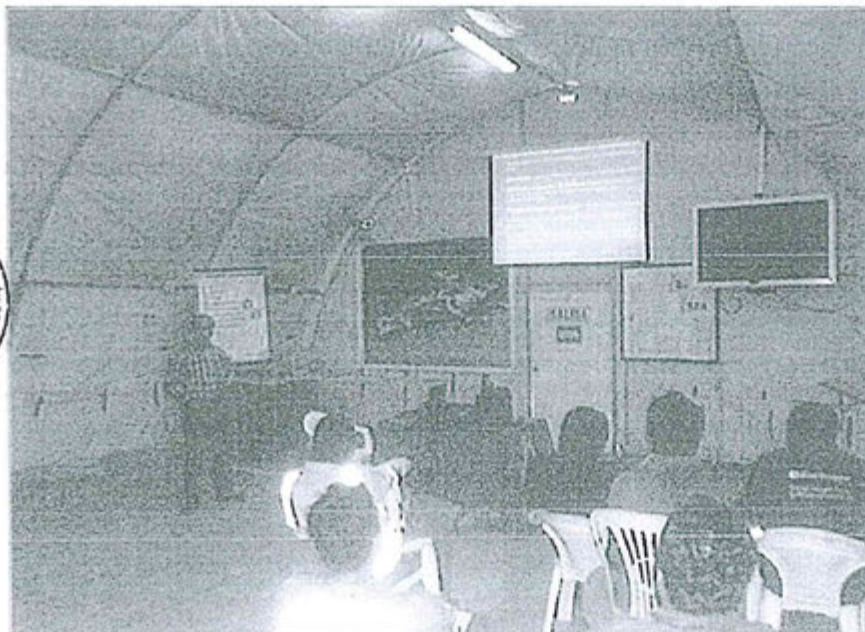
Fotografía N° 1 de la capacitación " La importancia de la correcta dosificación del cloro y su impacto sobre el medio ambiente "