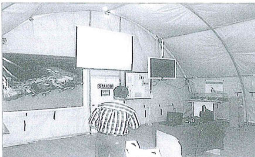
Fotografía N° 4 de la capacitación "La importancia de la correcta dosificación del cloro y su impacto sobre el medio ambiente"