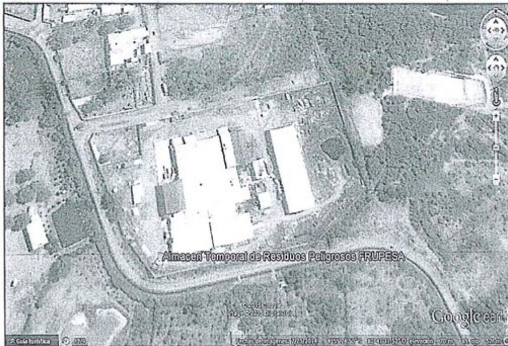
Ubicación del almacén temporal de residuos sólidos peligrosos Fotografía adjunta al escrito de fecha 22 de junio del 2015